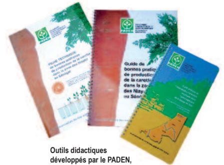
Outils didactiques développés par le PADEN, le début d'une longue série !

46 systèmes d'amélioration de l'irrigation installés dont 18 systèmes « goutte à goutte » et 28 « par aspersion » couvrant une superficie totale de 38 ha